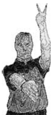
Exclusion (2 minutes)