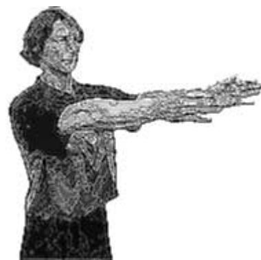
Remise en jeu