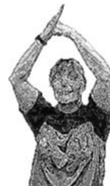
Passage en force