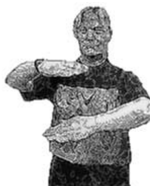
Marcher ou 3 secondes