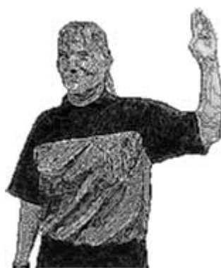
Avertissement pour jeu passif