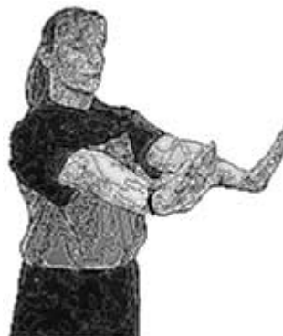
Non respect de la distance des « 3m »